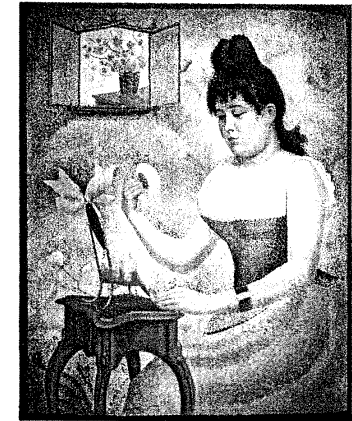
圖 3：作品名稱：對鏡擦粉的女人