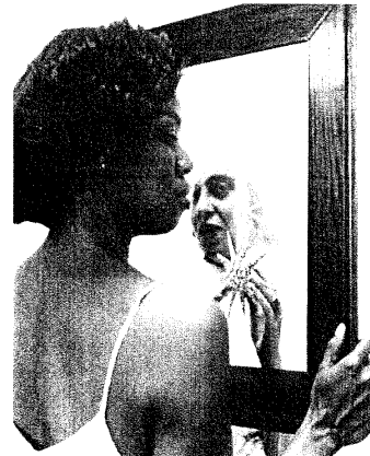
Looking into the mirror, the black woman asked, "Mirror, mirror on the wall, who's the finest of them all?" The mirror says, "Snow White, you black bitch, and don't you forget it!!!"

作品形式：互動產品。以馬達控制切割木塊，與人即時互動下，利用偵測人像的影像辨識手法，產生似馬賽克的影像。